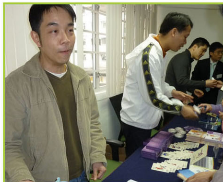
藥廠代表為出席朋友及會員 介紹各樣藥物的正確用法