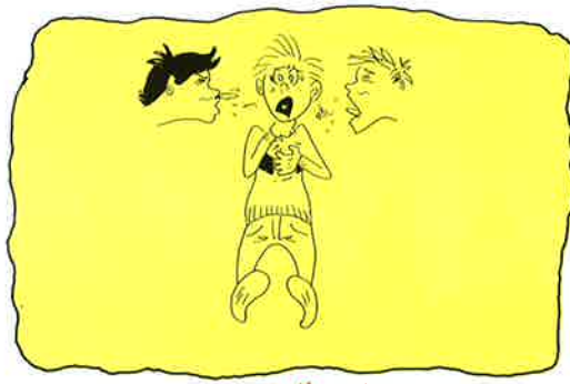
2. 小心避免感染流行性傳染病。