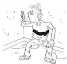
5. 天氣潮濕令哮喘患者感辛苦。