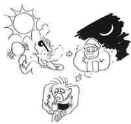
1. 天氣轉變容易誘發哮喘