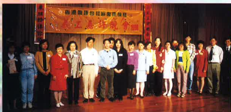
「義工嘉許晚會1998」 得獎者合照留念

在98年3月28日的香港復康會社區復康網絡「義工嘉許晚會」裡，香港哮喘會共有20位義工獲頒贈「服務嘉許獎」。