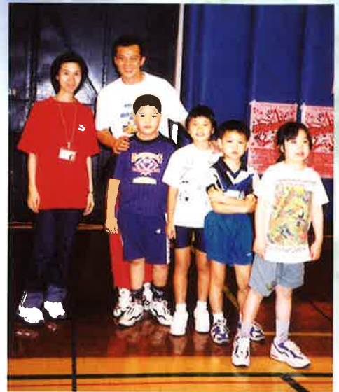
黃日華先生為香港哮喘會的會員作賽前打氣。