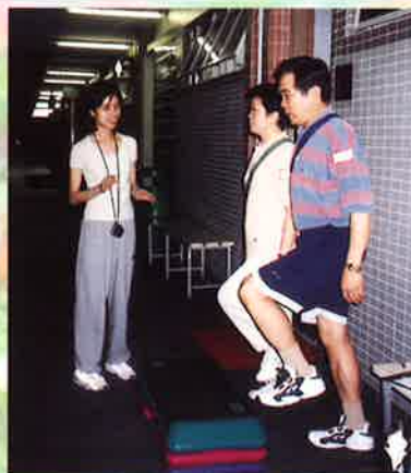
「步行訓練計劃」是1998年的一項創新活動。

在98年3月28日的香港復康會社區復康網絡「義工嘉許晚會」裡，香港哮喘會共有20位義工獲頒贈「服務嘉許獎」。