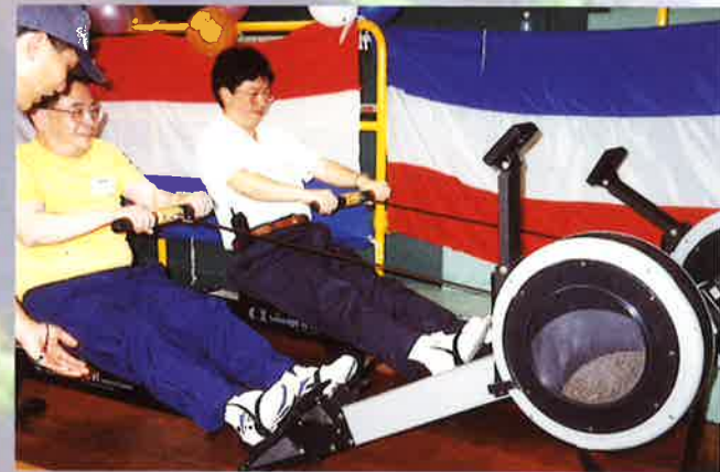
莫非陳醫生及賴醫生計劃在今年端午節之龍舟賽作參賽練習乎！