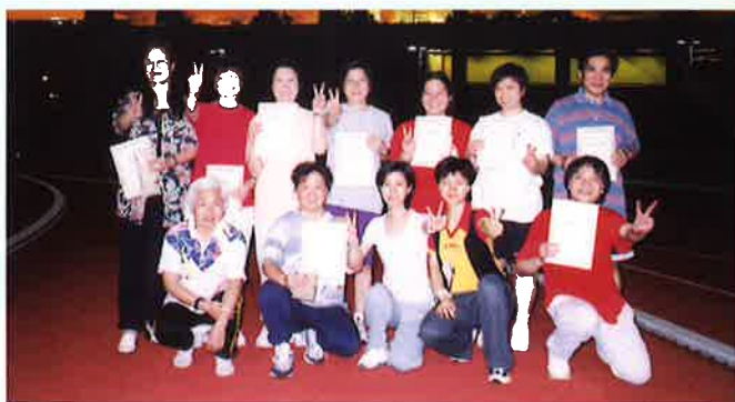
「步行訓練計劃」 畢業學員攝於聯校運動場。