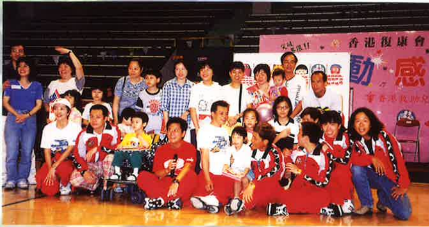
明星足球隊也來打氣助慶